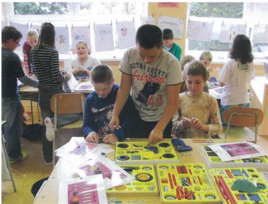
Podpora technického vzdělávání – tvoření ze stavebnic Merkur