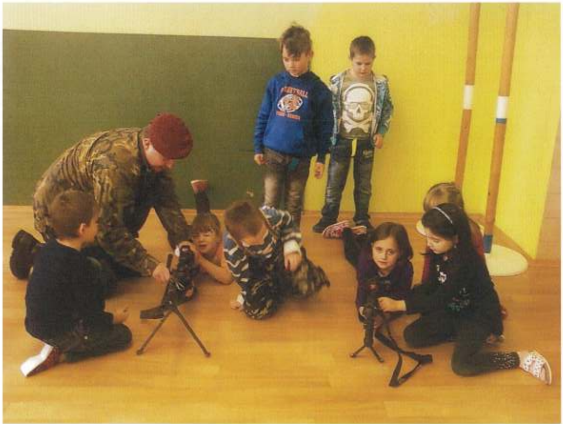
Beseda s vojáky – děti si postupně mohly prohlédnout zbraně, výstroj a vojenské auto