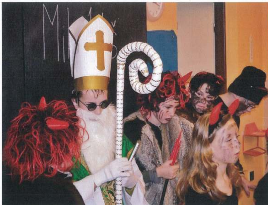
Mikuláš s anděly a čerty