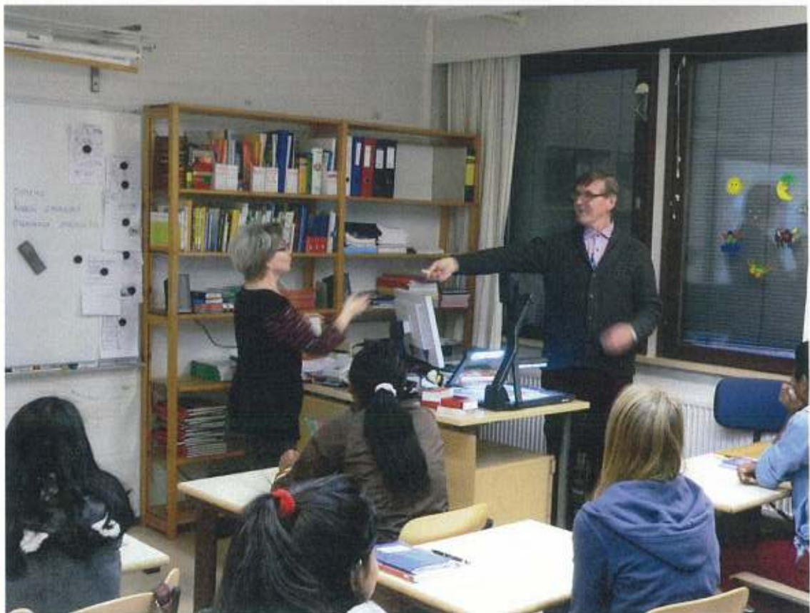
Základní škola v Helsinkách – přípravná třída pro imigranty