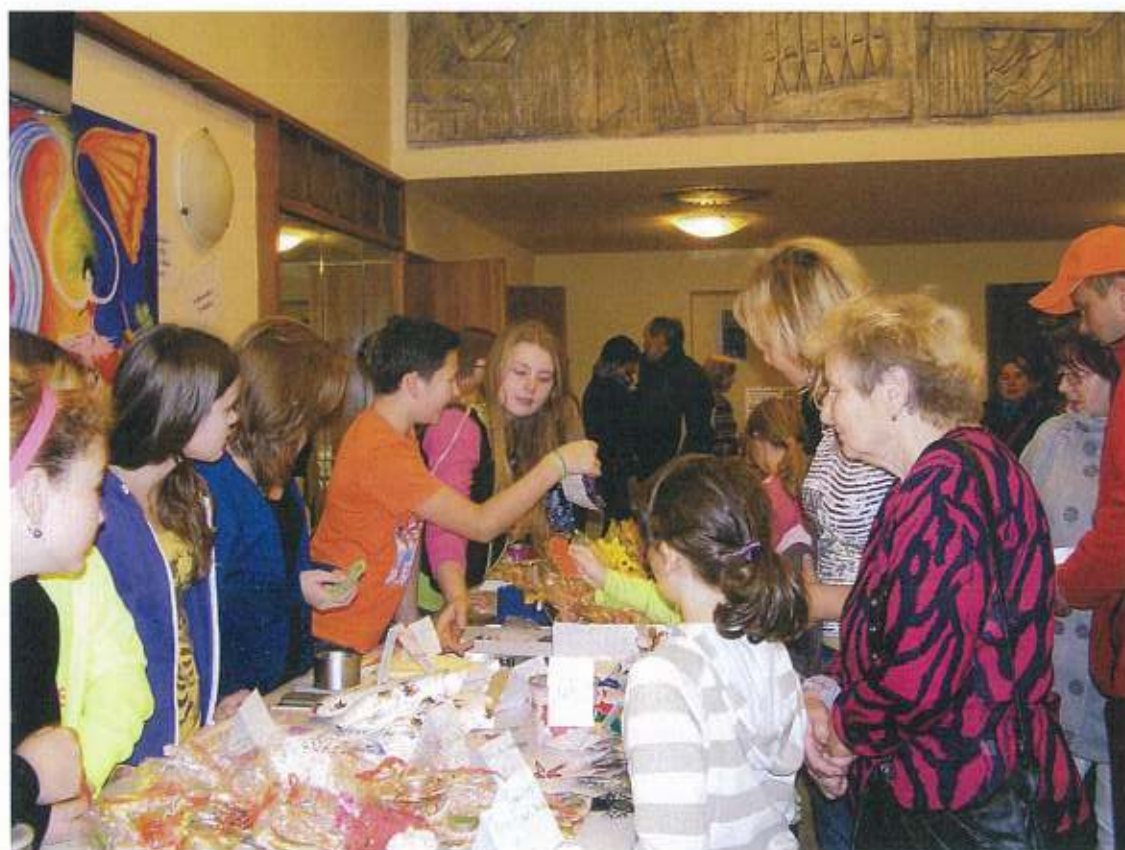
Pomoc africké vesnici Tengenenge – prodej výrobků na Předadventním světélkově