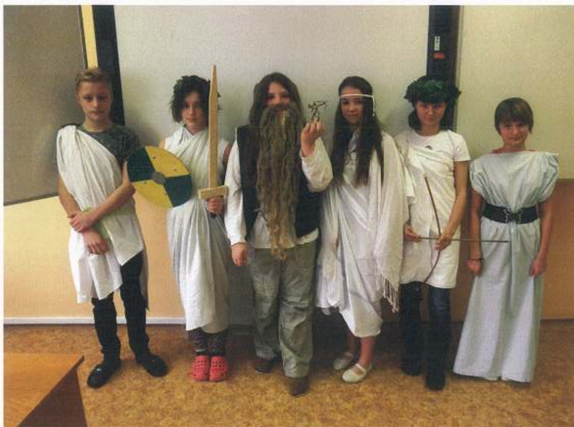
Biblické příběhy – hudebně dramatické vystoupení žáků