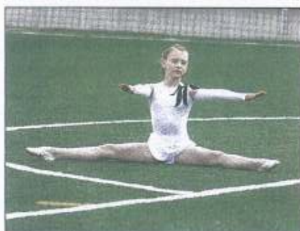
...nechyběla sólová gymnastika...