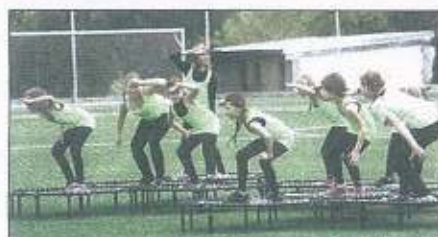
...anebo ukádky jumpingu na trampolínách.