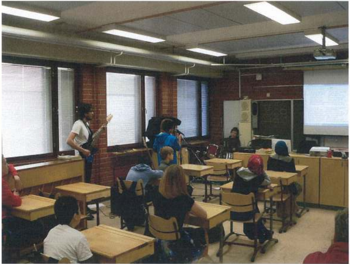
Základní škola v Helsinkách – výuka hudební výchovy v šestém ročníku