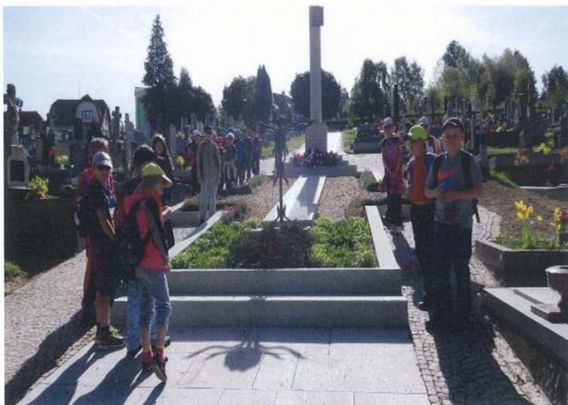
8. květen – uctění obětí druhé světové války