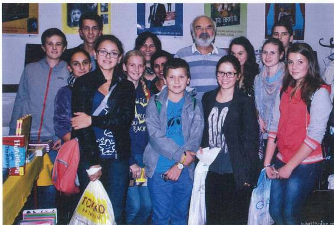
Knižní veletrh v Havlíčkově Brodě – setkání se Zdeňkem Svěrákem