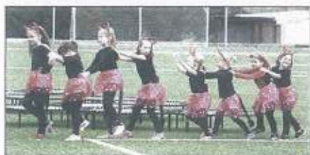
DĚTI se zdímových polybových kroužků Domu dětí a mládeže v Třešti předvedly při slavnosti ukádky tance...