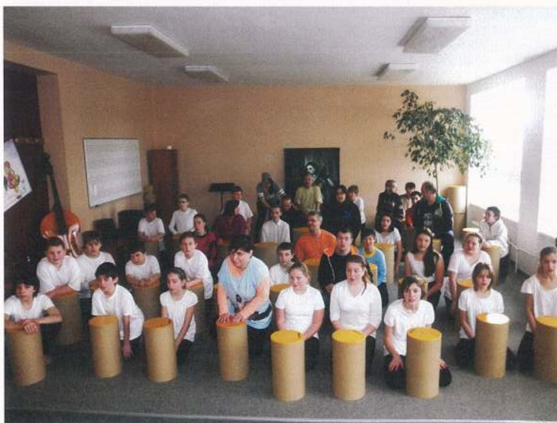
Denní a týdenní stacionář v Jihlavě – společné zpívání s žáky základní školy