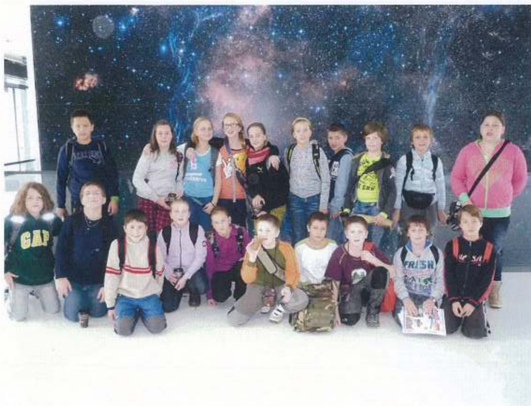
Brněnské digitárium – žáci zde absolvovali fantastickou cestu vesmírem