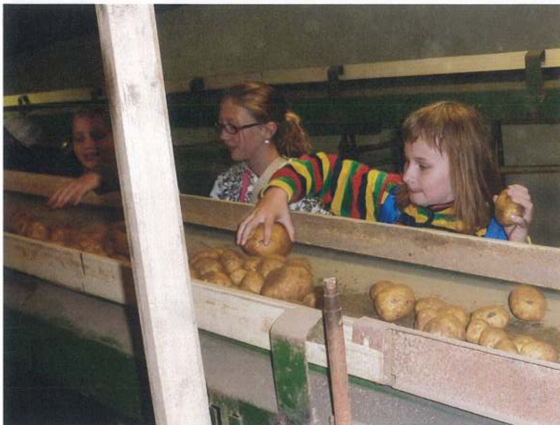
Propagace zemědělství na Vysočině – zemědělský podnik Telč