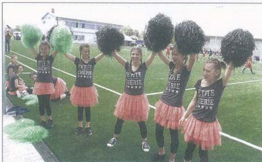
TŘEŠŤSKÉ ROZTLAŠKÁVAČKY se rozvíčují před fotbalovým zápasem. V pozadí rekonstruované kablny, které dostaly i nástavbu do patra.