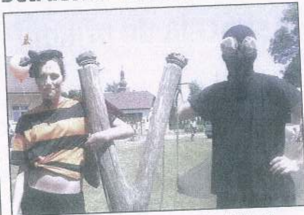
AKCI určenou dětem si v Horních Dubenkách všichni užili.