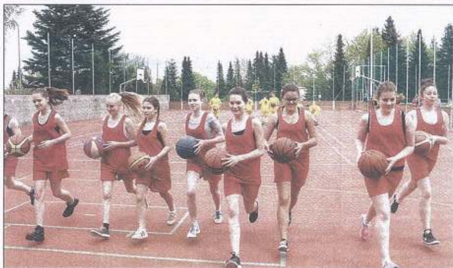
SOUČÁSTÍ POSTUPNÉ REKONSTRUKCE sportovního areálu v Třešti byla také modernizace víceúčelového hřiště. Tady při slavnostním otevření 9. května své umění představila místní basketbalová mládež.

Šlo o dva přátelské zápasy reprezentace ČR do 18 let proti výběru vrstevníků z Belgie. Jihlava hostila mezinárodní utkání po dlouhých 15 letech. „Pro nás