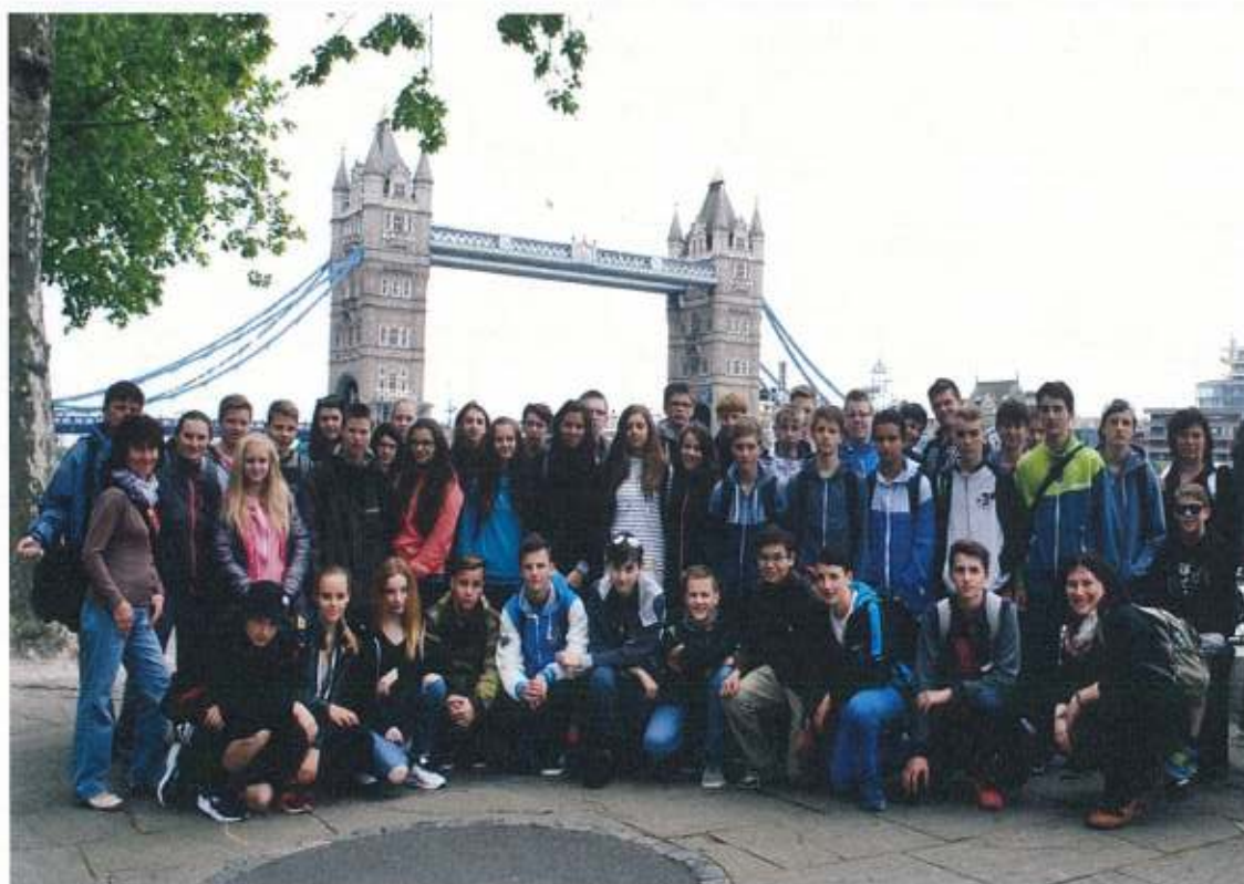
Poznávací pobyt v Londýně