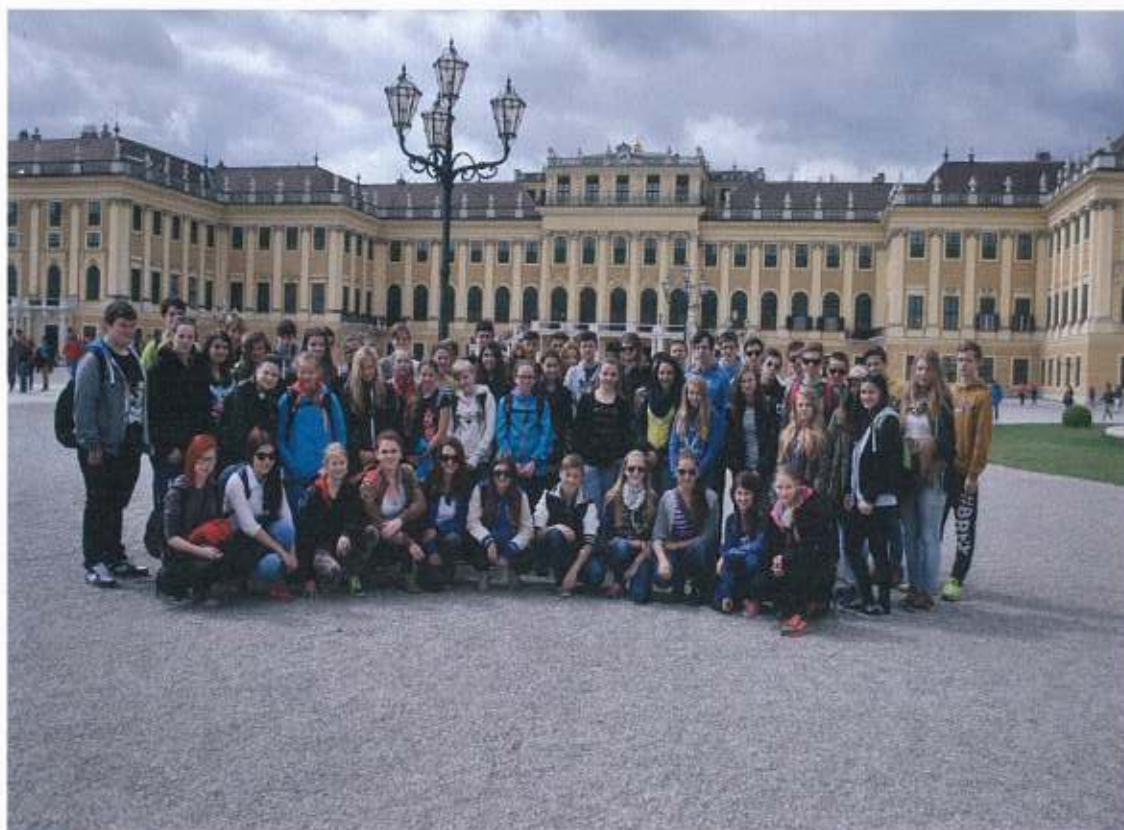
Návštěva rakouské metropole Vídně