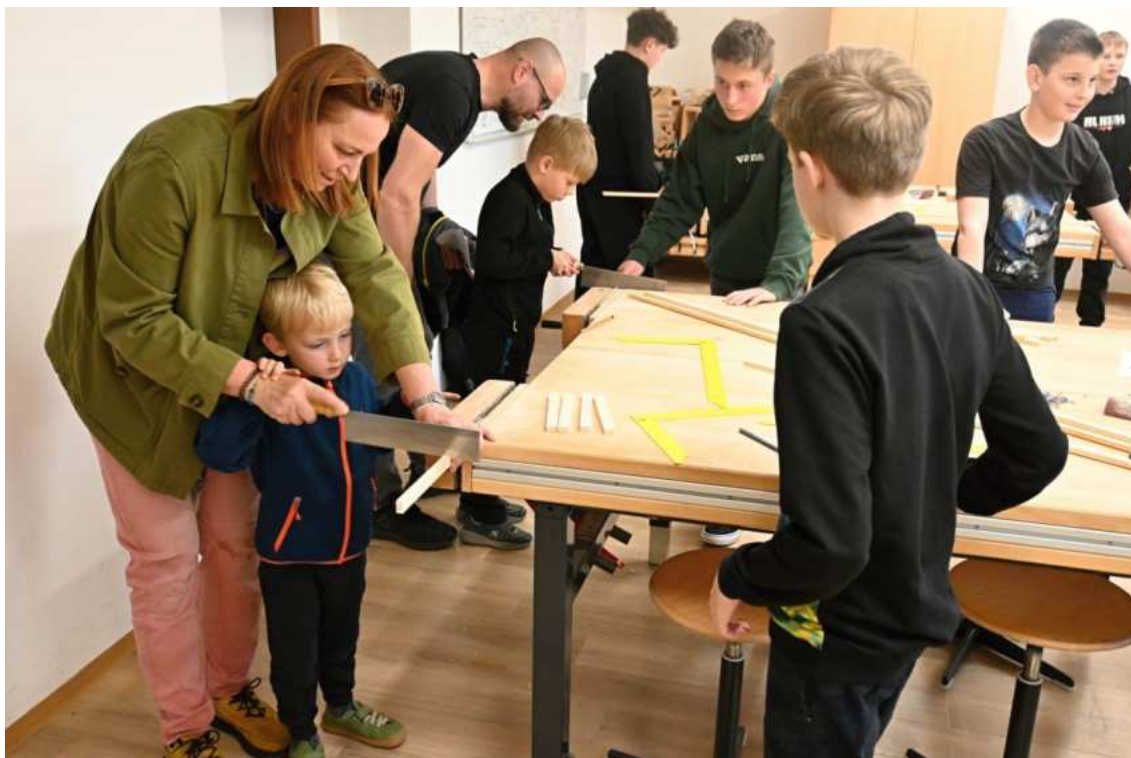
Jedna z aktivit akce Věda hrou