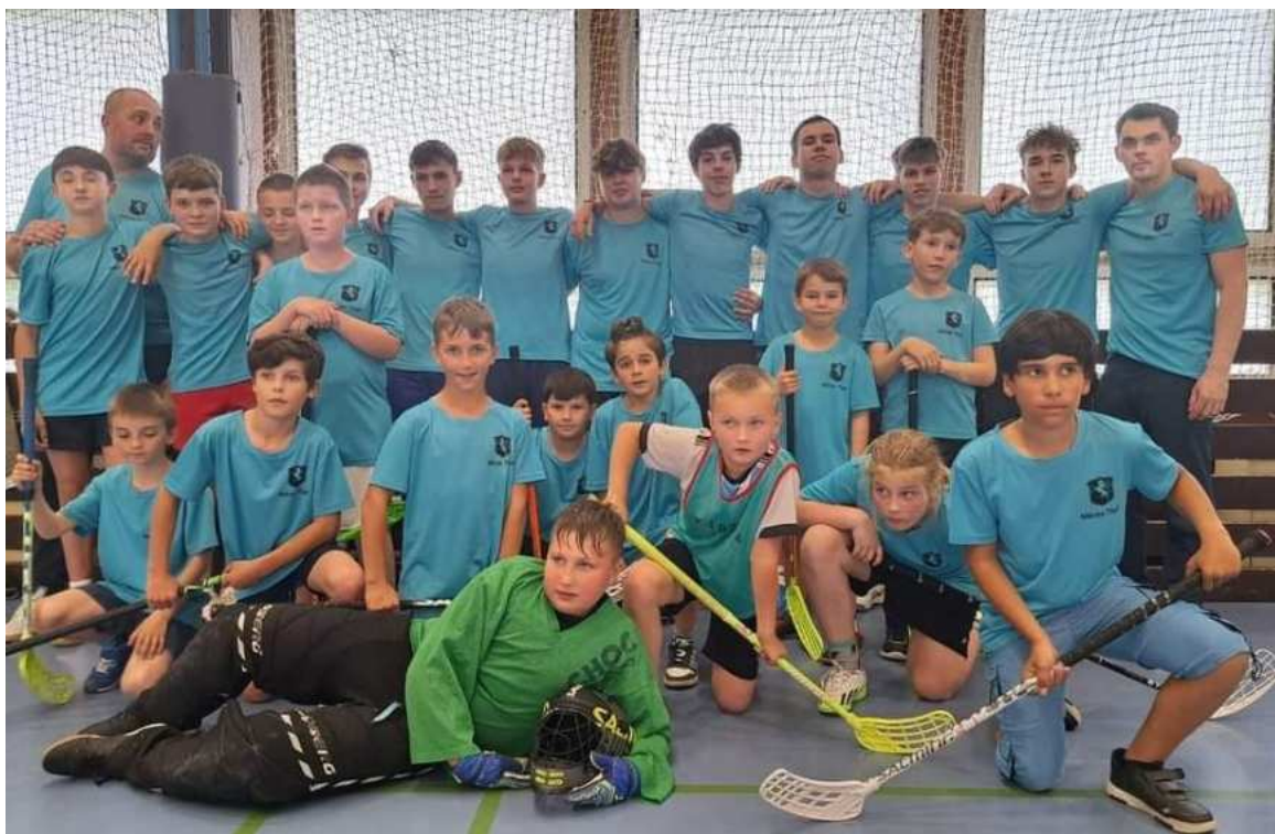
Florbalový kroužek DDM