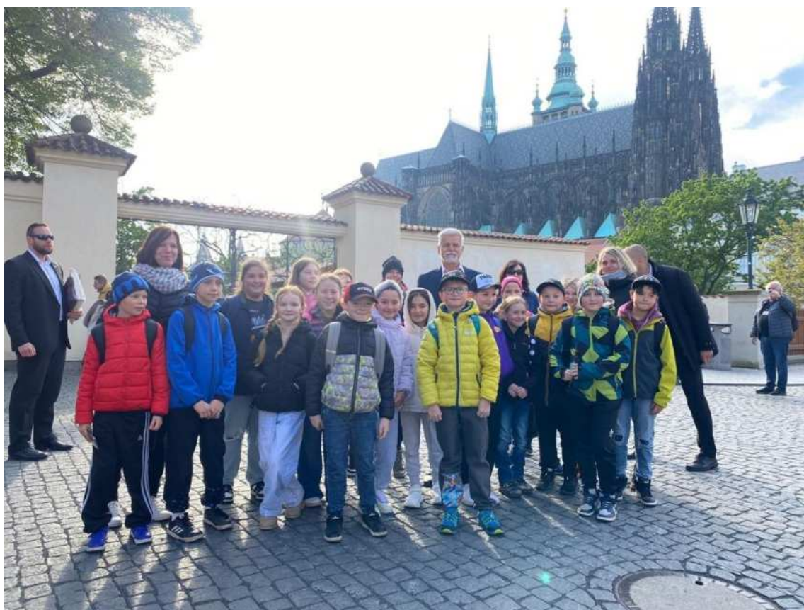
Setkání s panem prezidentem