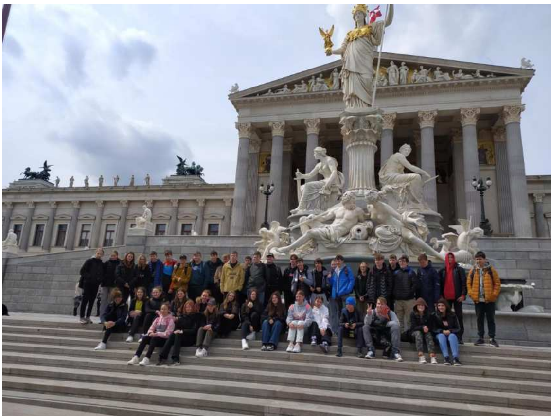
Žáci školy ve Vídni