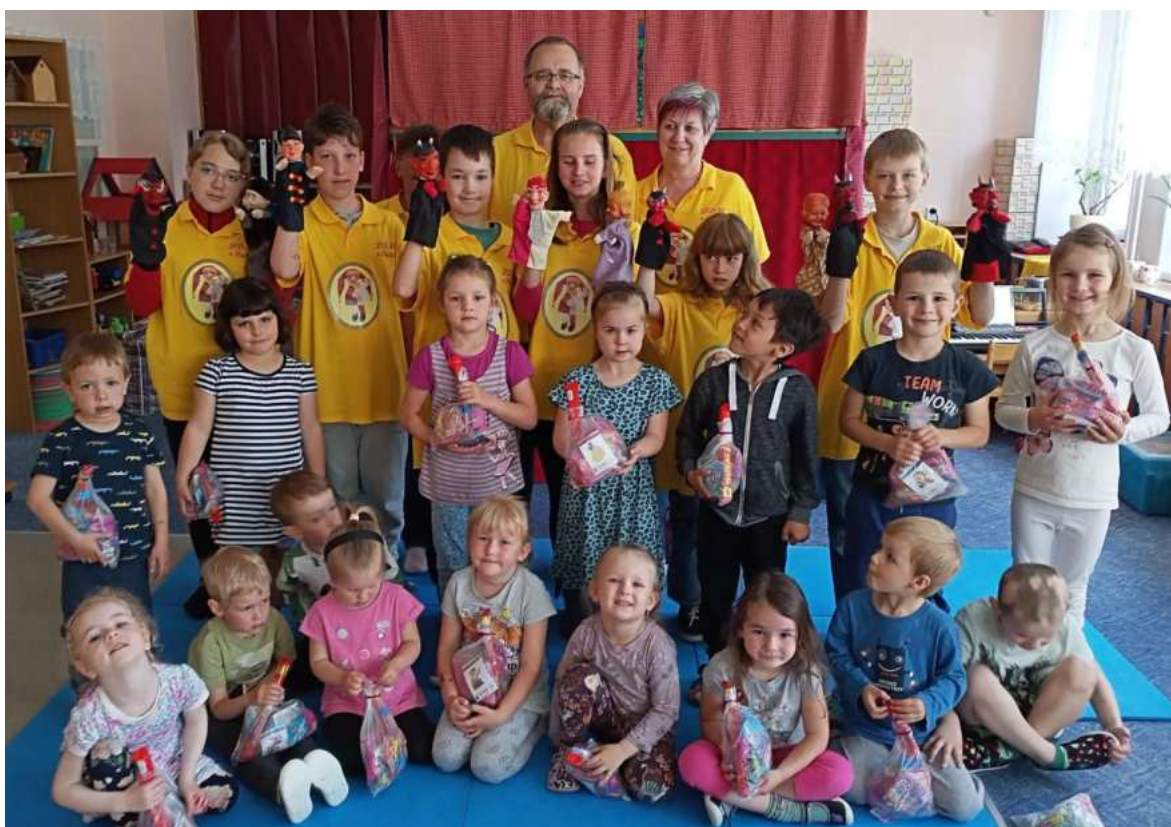
Loutkářský kroužek DDM