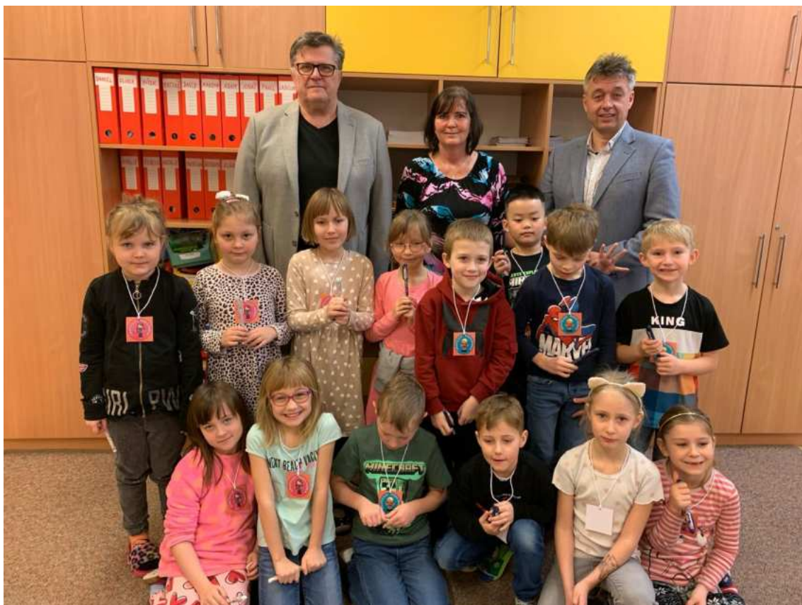
Pasování na písáře