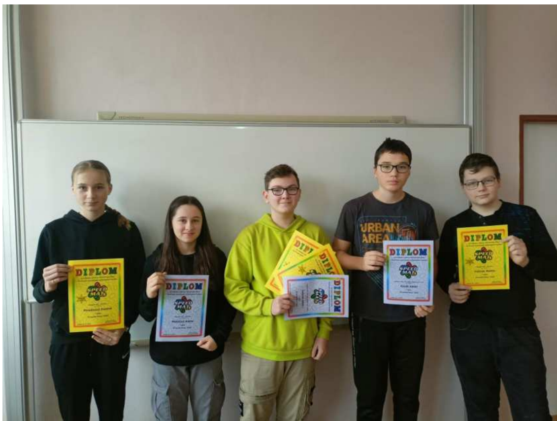
Úspěšní řešitelé mezinárodní matematické soutěže