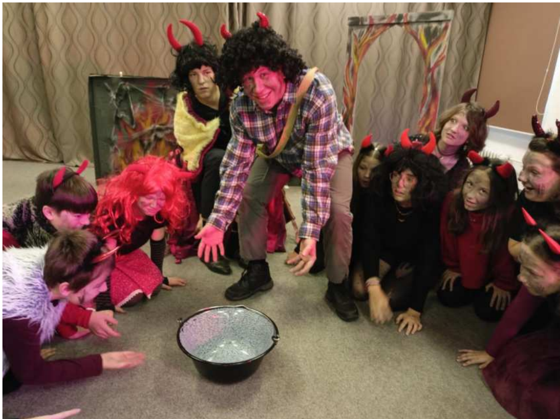
Divadelní soubor Třeštice – Čertovská babička