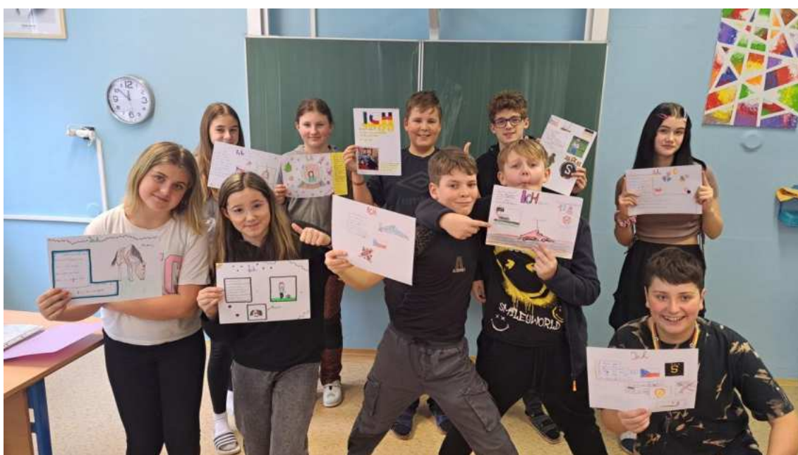
Skupina žáků při výuce německého jazyka