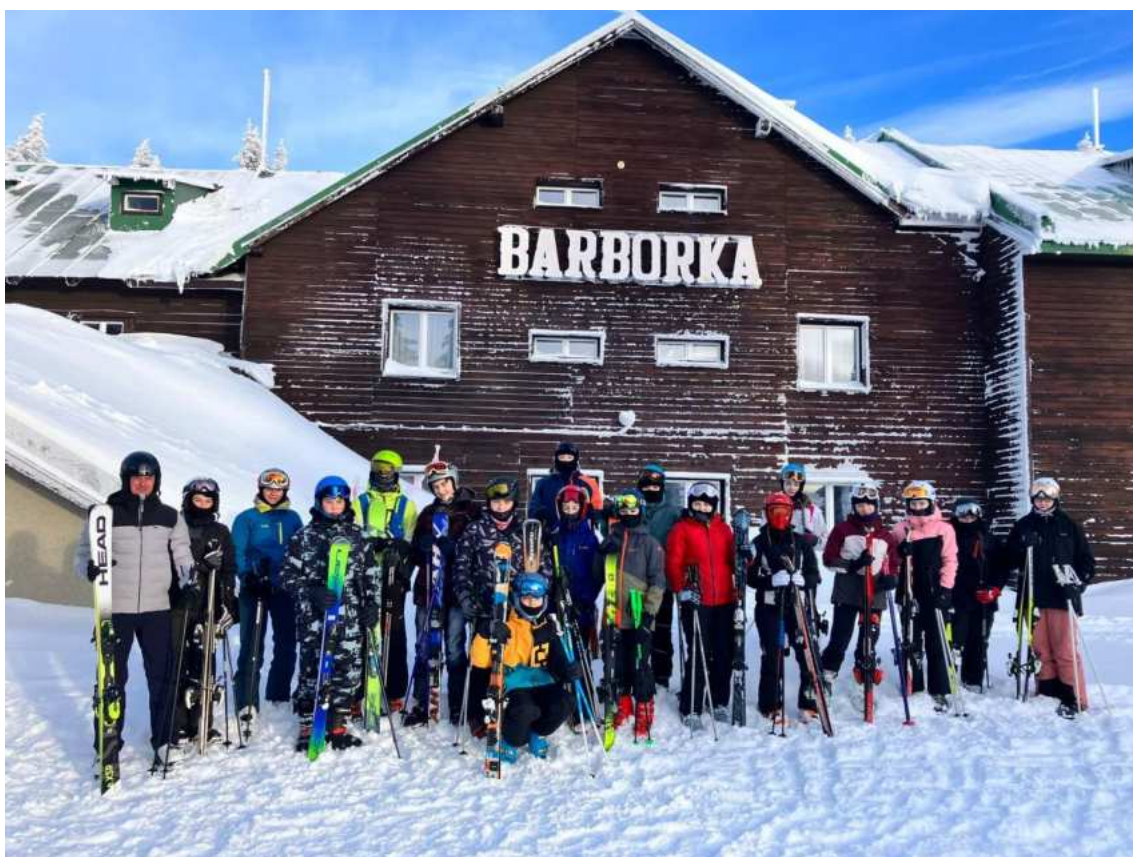
Lýžařský výcvikový kurz