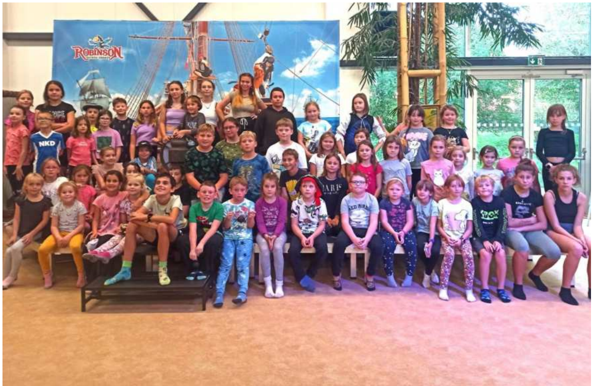
Návštěva zábavného parku Robinson v Jihlavě